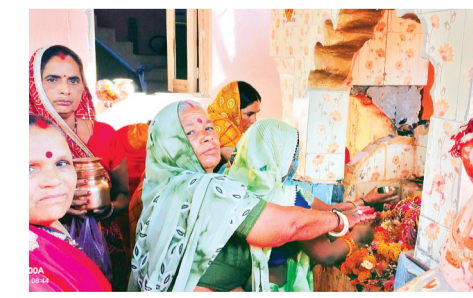
पूजा करने एवं नियम और संयम से व्रत