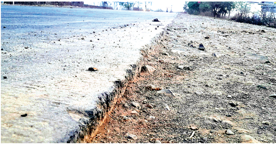
पीडल्यूडी के अधिकारियों ने नहीं की थी मॉनिटरिंग

कुछ ही सालों पहले करीब 50 करोड़ की लागत से बनाए गए राजगढ़-खुजनेर मार्ग के निर्माण में गुणवत्ता पर ध्यान नहीं दिया गया था। अधिकारियों द्वारा सही तरीके से मॉनिटरिंग नहीं किए जाने से पेटी कान्ट्रेक्टर घटिया निर्माण करके चले गए। उक्त घटिया निर्माण अब जाहिर होकर सामने आ रहे हैं। मार्ग के शोल्डर (पट्टी) अनेकों जगहों पर तीन से छह इंच तक धंस गए हैं। ऐसे में बाईक चालक अक्सर हादसों का शिकार हो रहे हैं। आपको बता दें कि राजगढ़ मुख्यालय से क्षेत्रीय विधायक अमरसिंह यादव के गृहनगर खुजनेर तक इस उक्त मार्ग को बनवाया गया था। जब बड़े जनप्रतिनिधियों के रोजाना आवाजाही वाले मार्गों की यह हालत है तो क्षेत्र के अन्य मार्गों की स्थिति का स्वतः ही अंदाजा लगाया जा सकता है।