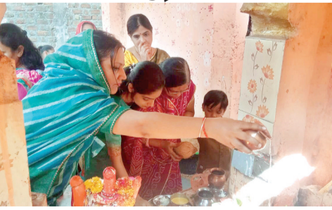
देवी धन-धान्य से पूर्ण कर प्राकृतिक विपदाओं से दूर रखती हैं। इसके साथ ही पूजा करने एवं नियम और संयम से व्रत

सोमवार को शीतला सप्तमी पर सुबह से ही माता शीतला के मंदिरों में महिलाओं की भीड़ देखने को मिली। नगर के प्राचीन मां बिजासन माता के मंदिर में नगर की महिलाओं की शीतला माता की पूजन के लिए भीड़ लगी रही। मंदिर में सुबह से ही भीड़ के आलम यह थे कि अपनी बारी का इंतजार करते हुए महिलाओं को पूजा के लिए इंतजार करना पड़ा। शीतला सप्तमी होली के सातवें दिन चैत्र माह के कृष्णपक्ष की सप्तमी तिथि पर मनाया जाता है। इस दिन शीतला माता का पूजन बासी और ठंडे व्यंजनों का भोग लगाया है। जिसके बाद घर के सभी सदस्य सिर्फ ठंडे व्यंजन ही खाते हैं। शीतला माता का मंदिर वटवृक्ष के समीप ही होता है। इसलिए शीतला माता के पूजन के बाद वट की पूजा भी की जाती है। ऐसी मान्यता है कि इस व्रत को करने से शीतला